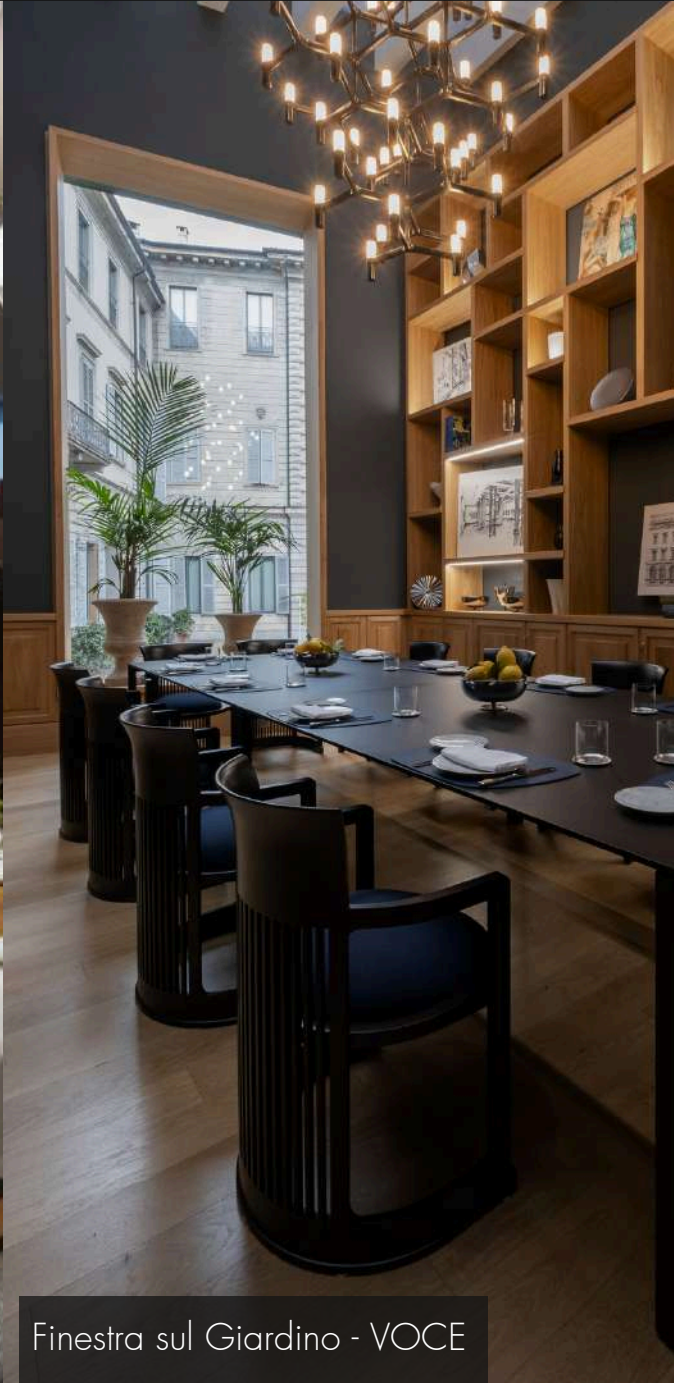
Finestra sul Giardino - VOCE