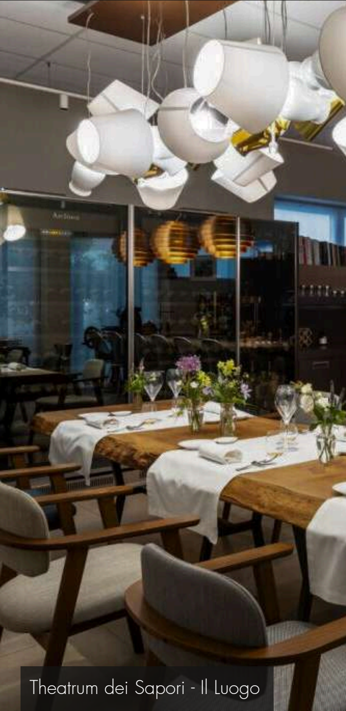
Theatrum dei Saporì - Il Luogo