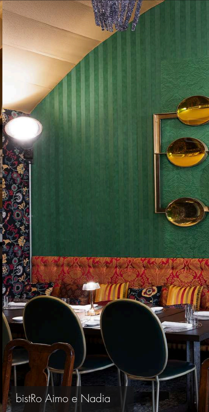
bistRò Aimò e Nadia